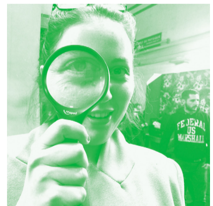
LA RÉALISATRICE : ISABELLE LAURENT

Pour cette première édition dans la Galerie Houg , les artistes de System_F et la réalisatrice Isabelle Laurent nous invitent dans une fiction où les notions de réalité, nature, numérique, conscient et inconscient s'entremêlent autour d'un paysage onirique , plastique et virtuel et au sein d'une expérience psychique révélatrice.